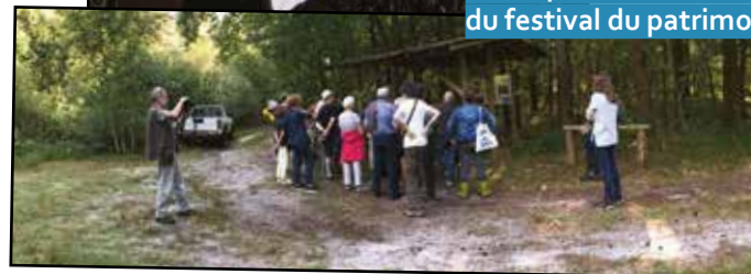
Visite pendant la semaine du festival du patrimoine