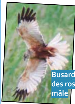
Busard des roseaux mâle