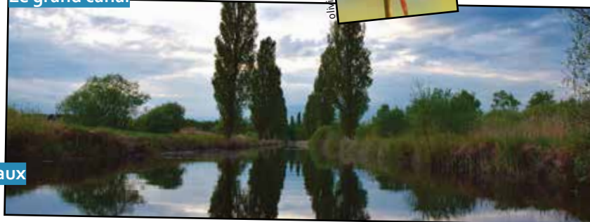
Le grand canal

Retrouvez-nous sur notre page Facebook Marais de Larchant pour suivre nos actualités. De nombreuses photos, planning des visites et les dernières nouvelles du Marais.