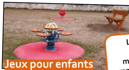
Jeux pour enfants

Le repas des Aînés est prévu, le samedi 15 décembre à 12 heures la salle de la Sablonnière