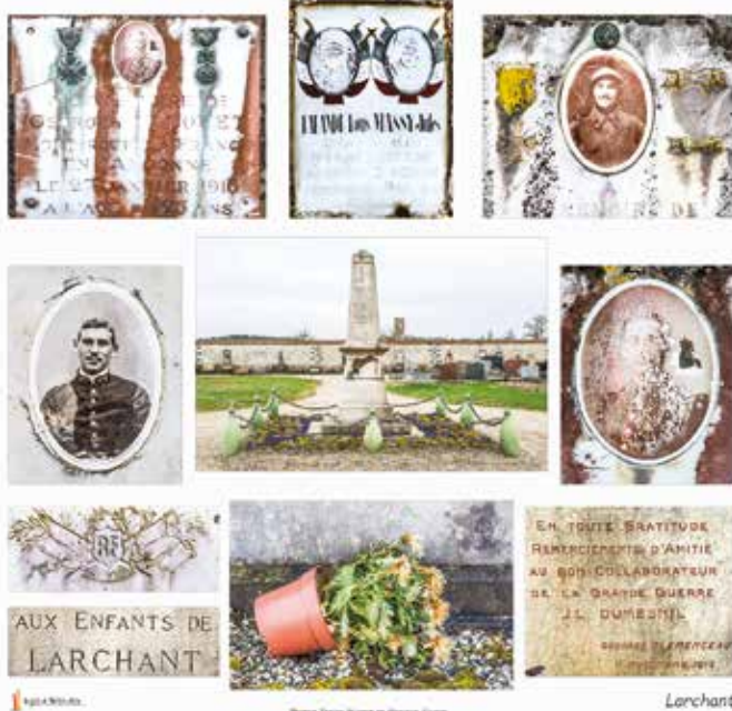
2018 - Centenaire de la Grande Guerre

Le repas des Aînés est prévu, le samedi 15 décembre à 12 heures la salle de la Sablonnière