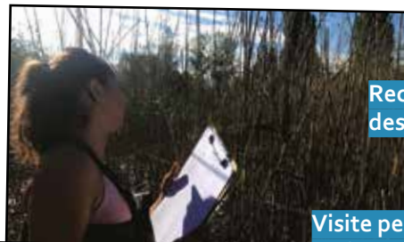
Recensement des roselières

L'équipe se renforce avec une nouvelle stagiaire en alternance à partir de septembre